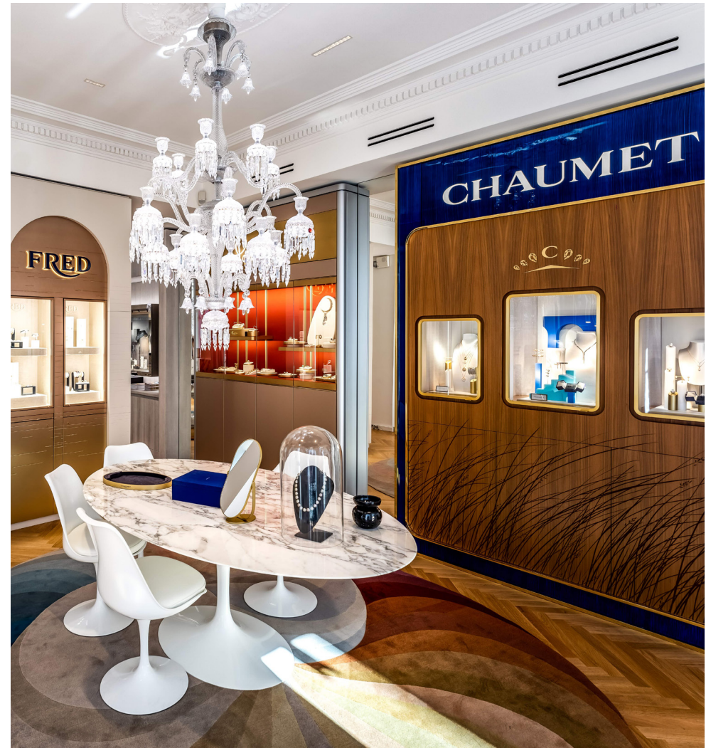
Boutique Édouard Genton 3 rue du Dôme, Strasbourg